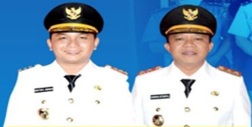
BAKHTIAR AHMAD SIBARANI BUPATI TAPANULI TENGAH

UPDATE DATA PASIEN PADA TANGGAL 09 JUNI 2020